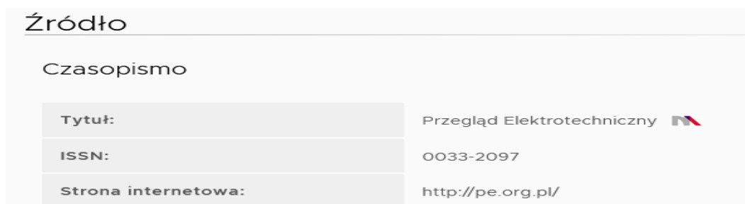
Rys.. 5. Widok fragment rekordu publikacyjnego w bazie PBN (system POL-on) z ikonką MNiSW/MEiN (dostęp www: 2.10.2022.)